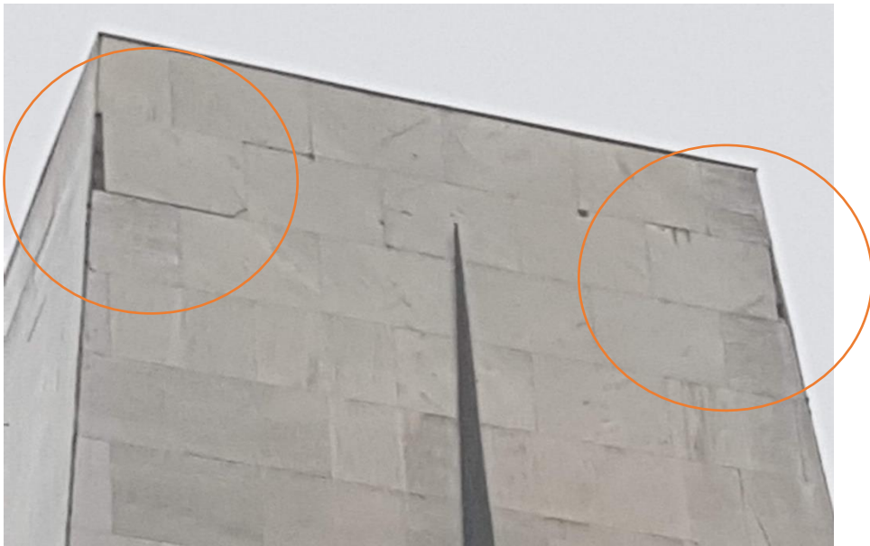
Φωτ. 1. Επικίνδυνα μάρμαρα προς κατάρρευση στην απόληξη της κατασκευής.

Επιπρόσθετα και σύμφωνα με την από 20-11-2019 σχετική αυτοψία της Διεύθυνσης Τεχνικών Υπηρεσιών «συμπεραίνεται η επικινδυνότητα της κατασκευής του μνημείου λόγω κινδύνου αποκόλλησης και πτώσης των μαρμάρων και προτείνεται η συνολική καθαίρεση των μαρμάρινων πλακών επένδυσης και αντικατάστασή τους με νέες με ανάρτηση με μεταλλικά στοιχεία από τον σκελετό οπλισμένου σκυροδέματος» .